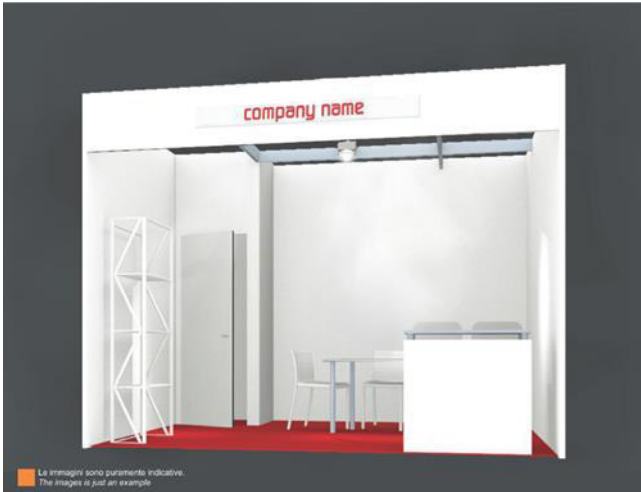
The image is just an example

BI-MU ALL INCLUSIVE , the formula that joins together quality, limited expense and turnkey services, is the ideal choice for companies that want to take part in 32.BI-MU with a minimum investment and optimally.