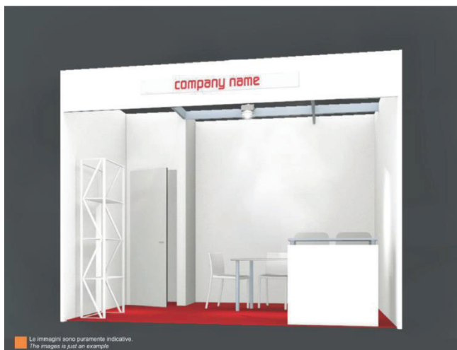
La immagini sono puramente indicative. The images is just an example Immagine puramente indicativa

La partecipazione mediante la formula BI-MU ALL INCLUSIVE , sintetizza qualità, prezzo contenuto e servizi chiavi in mano ed è la scelta ideale per quelle imprese che desiderano partecipare a 32.BI-MU in modo ottimale e con un investimento minimo.