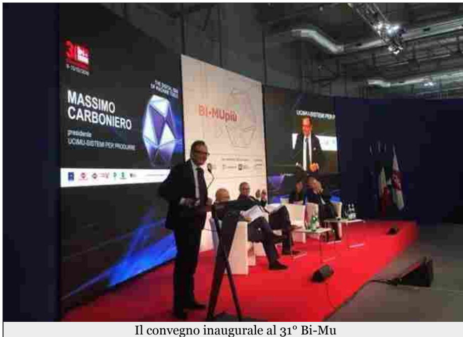
Il convegno inaugurale al 31° Bi-Mu

E' in programma fino a sabato 13 ottobre, a Fieramilano Rho il 31.BI-MU/SFORTEC INDUSTRY, biennale internazionale della macchina utensile, robot, automazione, tecnologie ausiliarie, digital manufacturing e tecnologie abilitanti, promossa da UCIMU-SISTEMI PER PRODURRE , l'associazione dei costruttori italiani di macchine utensili , robot e automazione, e organizzata da EFIM-ENTE FIERE ITALIANE MACCHINE.