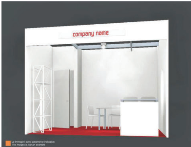
Immagine puramente indicativa

La partecipazione mediante la formula BI-MU ALL INCLUSIVE , sintetizza qualità, prezzo contenuto e servizi chiavi in mano ed è la scelta ideale per quelle imprese che desiderano partecipare a 32.BI-MU in modo ottimale e con un investimento minimo.