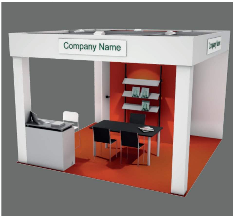
Soluzione 3 lati aperti / Three open sides booth