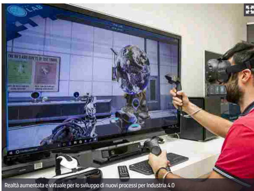
Realtà aumentata e virtuale per lo sviluppo di nuovi processi per Industria 4.0