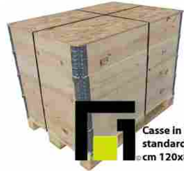
Casse in legno standard cm 120x80