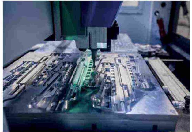
A destra: BI-MU sarà l'occasione per i visitatori di conoscere le ultime novità tecnologiche del settore

nesse, componenti, sistemi e intelligenza artificiale, RobotHeart nasce in risposta alla necessità del settore