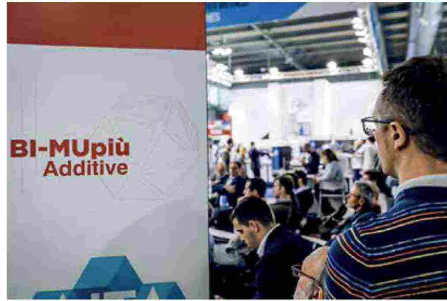
Altra area di innovazione sarà Più Additive, dedicata all'Additive Manufacturing

servizi, esposizioni e approfondimenti tematici, molti dei quali trasversali a entrambe le mostre, permettendo agli operatori coinvolti di pianificare al meglio le due visite ottimizzando i costi di trasferta.