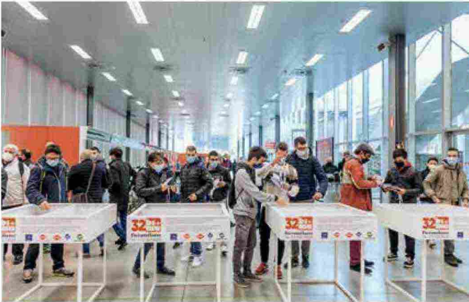
A sinistra: la manifestazione si svolgerà dal 12 al 15 ottobre